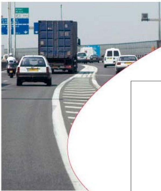
Parts modales des différents moyens de transport, Ile de Montréal, 1998